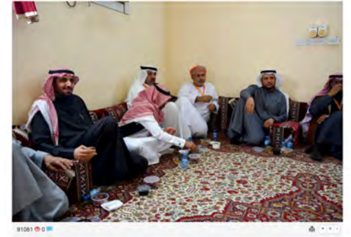
جمعية سفراء التراث يزورون قرية المنسف التاريخية